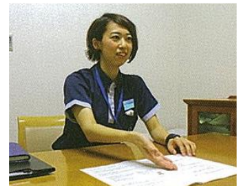
■インタビュー面談中 「わたしがあなたの入院中の担当SWです」

在宅復帰を目指す回復期では、SWはコーディネーター。患者・家族の想いを汲み取り、社会資源活用の情報提供、そして他職種を俯瞰し、鳥の目で見渡してくれています。 多職種から尊敬される専門職です。(回復期支援局長 Ns)