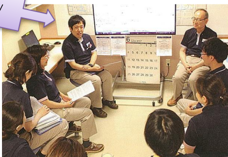
■カンファレンスで 患者・家族の代弁とアセスメントをプレゼンします 「患者さまはいまこのような気持ちでいて、将来はこうなりたい、とイメージしています」